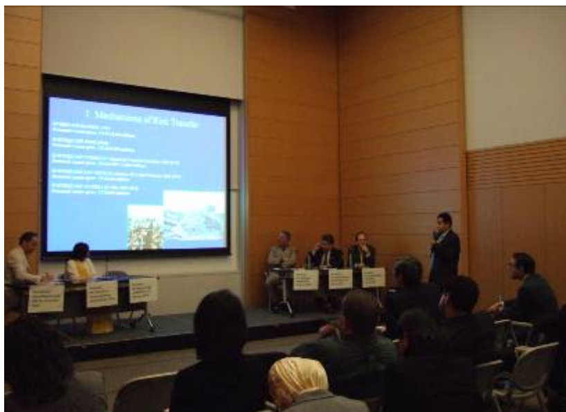
■ 2007.11 「大都市地震災害軽減のための総合戦略」コース フォローアップ Follow-up Workshop on the course of “ Mitigation Strategy for Mega-Urban Earthquake Disaster ” in Japan