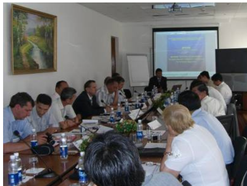
■ 2007.6 「中央アジア・コーカサス地域防災行政」コース フォローアップ Follow-up Workshop on the course of “ Disaster Prevention Management for Central Asia and the Caucasus ” in Kazakhstan

【PLAN】 2008.2 「アンデス地域災害医療マネジメント」コース フォローアップ Follow-up Workshop on the course of “ Medical Management for Disasters in Andean countries ” in Peru