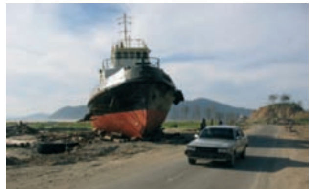
Se ocasionarán muchos daños durante un tsunami, ya que los barcos pueden colisionar o encallar en la costa.

Las áreas costeras normalmente tienen mucha población y un alto grado de desarrollo. Representan una parte importante de la vida y la productividad nacional. Los planificadores deben aprovechar estas características para mejorar la seguridad en las siguientes zonas :