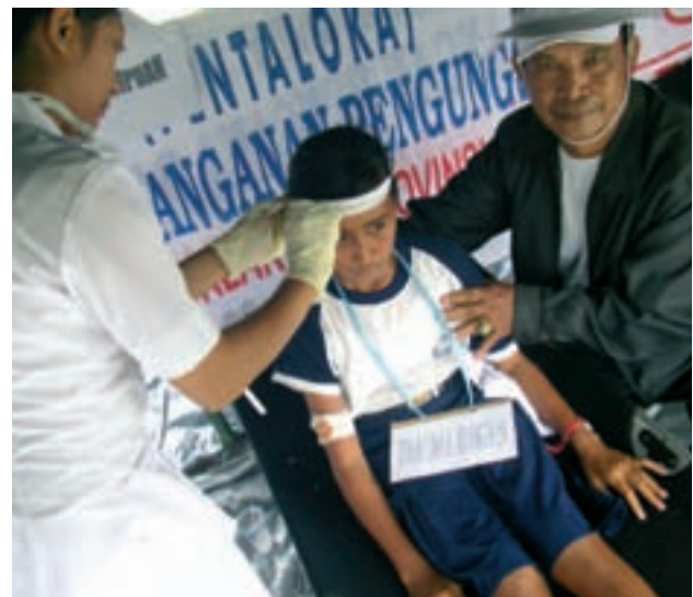
Tras un tsunami, el centro local de emergencia debe estar listo para actuar.