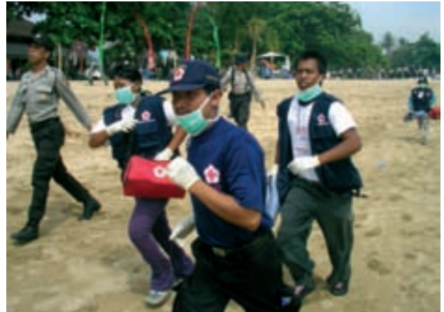
La creación de una organización de defensa civil que periódicamente realice prácticas de sus actividades es un requisito fundamental para la preparación para casos de desastre.

No existe un método óptimo para los barcos que se están