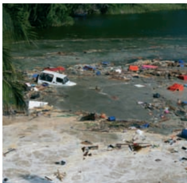
Entre los daños secundarios causados por tsunamis pueden contarse escombros flotantes, incendios y daños provocados por sustancias químicas, como el petróleo.

Para proteger a las personas y a la propiedad contra el daño causado por un tsunami hipotético, primero debe calcularse el tipo y la escala de los daños esperados.