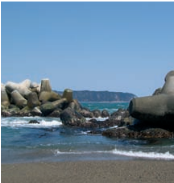
Las olas pierden bastante fuerza cuando se estrellan contra una escollera como ésta, construida para proteger un puerto en la costa del Pacífico