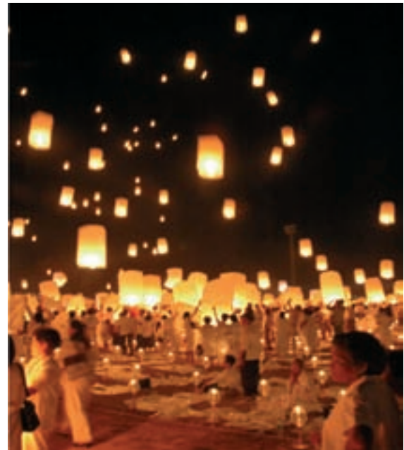
Ceremonia conmemorativa en Khao Lak (Tailandia) por el aniversario del tsunami de 2004: una luminaria soltada al cielo en memoria de cada una de las 2.000 personas que perecieron en dicha catástrofe.

Los sitios de evacuación (refugios) albergan y protegen temporalmente a los evacuados después de que sus viviendas hayan sido destruidas o amenazadas por un terremoto o incendio. Comúnmente se emplean las escuelas y salones comunitarios.