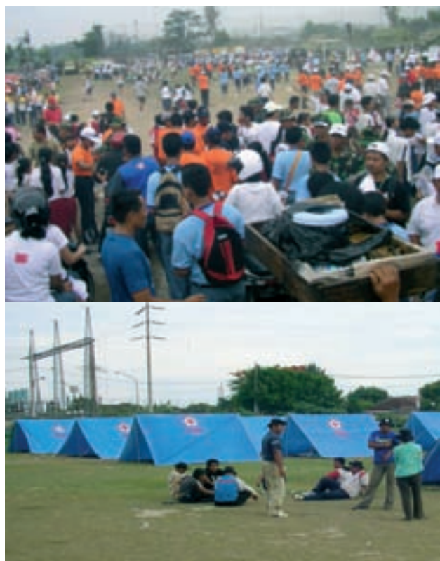
La ubicación de los lugares de evacuación y rescate en zonas seguras es de suma importancia para diseñar un plan de preparación de la comunidad en caso de tsunami.

Cuando la evacuación y construcción anti-tsunami se planifica a lo largo de la costa, o cuando deben garantizarse áreas