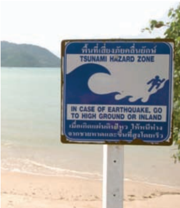
Carteles como éste en una playa de Tailandia advierten a los residentes costeros que se dirijan a terrenos altos en caso de terremoto.