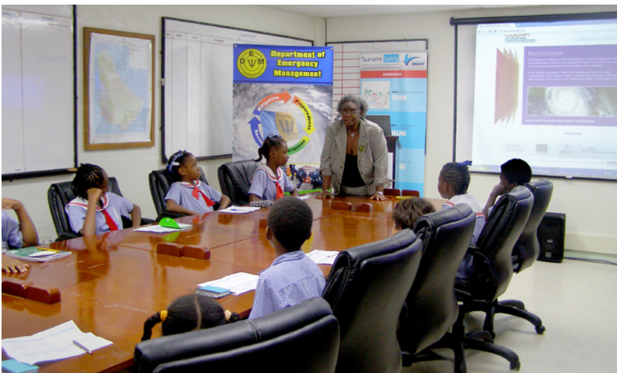
Departamento de Gestión de Emergencias (DEM), 2013

Las prácticas exitosas de comunicación que hacen partícipes a los jóvenes generan efectos multiplicadores, ya que a su vez la juventud puede lograr que participen familiares y otros grupos de la comunidad en la RRD.