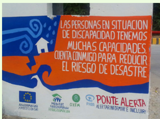
Plan International, 2012