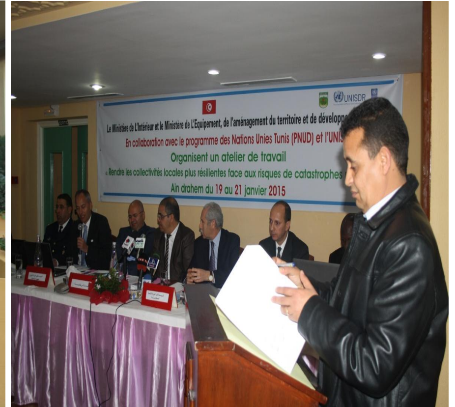
ورشة عمل حول دعم القدرات المحلية لمجابهة الكوارث 19 الى 21 جانفي 2015