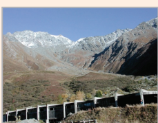
Visite de terrain 1 : Route du Grand St-Bernard Gestion des risques sur un axe de transit international

Réduction du risque de catastrophe dans les Alpes suisses : défis et opportunités. Le vendredi 24 mai, la Suisse proposera aux participants inscrits à la Plate-forme Mondiale de choisir une visite de terrain parmi les trois qui leur seront proposées. Ces visites se dérouleront de 8 heures à 18 heures. Les participants feront le trajet depuis Genève en train au départ de la gare principale de Cornavin. Le coût de la visite s'élève à 50 francs suisses par participant. Le nombre de places étant limité, nous appliquerons le principe du premier arrivé, premier servi. La visite de terrain vise à informer les participants sur les menaces et les défis propres à un environnement alpin à risque, ainsi que les mesures permettant d'y faire face. Pour toute information complémentaire, veuillez consulter le site suivant: www.preventionweb.net/globalplatform/2013/programme/field-visits