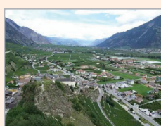
Visite de terrain 2 : Le Rhône Gestion des risques d'inondation