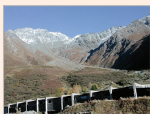
Visita de campo 1: Route du Grand St-Bernard Gestión del riesgo a lo largo de una ruta de tránsito internacional

Reducción del riesgo de desastres en los Alpes suizos: retos y oportunidades. El viernes 24 de mayo, Suiza invita a los participantes inscritos en la Plataforma Mundial a elegir una de las tres visitas de campo. Las visitas de campo se llevarán a cabo de 08:00 a 18:00 horas. Los participantes partirán y regresarán desde la estación principal de trenes de Ginebra (Cornavin). El coste es de 50 CHF (francos suizos) por participante. Puesto que la capacidad es limitada, la inscripción para la visita de campo se irá aceptando por orden de llegada según se vayan recibiendo. El objetivo de las visitas de campo es proporcionar un enfoque de las amenazas, los desafíos y las medidas de adaptación de vivir en un ambiente proclive al riesgo alpino. Para más información, visite: www.preventionweb.net/globalplatform/2013/programme/field-visits