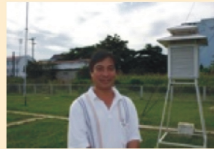
Trung tâm khí tượng thủy văn tỉnh Kon Tum