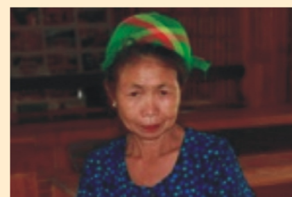
Người dân tại Nghệ An

Dựa trên kinh nghiệm thực tế có được, báo cáo trước hết đưa ra những khuyến nghị về cách hoàn thiện chung cho Sổ tay VCA. Những khuyến nghị đề cập đến việc xác định các nhóm đối tượng mục tiêu và thiết kế sổ tay một cách sát thực cho các nhóm này nhằm nâng cao tính hữu dụng của nó. Chẳng hạn như, phương pháp tiếp cận sinh động, có tính giáo dục, có sự tham gia, dùng các ví dụ cụ thể qua các câu chuyện được trình bày là cần thiết để chuyển tải thông tin tới các thành viên cộng đồng trong quá trình đánh giá. Điều đó yêu cầu hướng dẫn viên phải chủ động học hỏi từ phản ứng thực tế của người tham gia và điều chỉnh tài liệu cũng như công cụ tại chỗ hoặc sau mỗi buổi họp. Mục đích chính của chúng tôi là chia sẻ những kinh nghiệm này để điều chỉnh và thích ứng cho cuốn sổ tay VCA thành một tài liệu hỗ trợ cho các cán bộ thực hiện quản lý thiên tai dựa vào cộng đồng ở vùng cao Việt Nam. Chúng tôi cũng đưa ra một số đề xuất điều chỉnh nhỏ nhưng khá hiệu quả nhằm hoàn thiện ở các lần tái bản sau của sổ tay VCA.