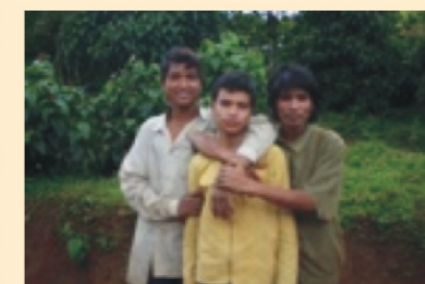
Người dân tại địa bàn dự án ở Kon Tum