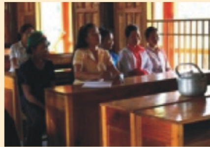
Hội thảo VCA cho Hội phụ nữ tại Nghệ An