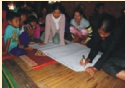
Đánh giá VCA tại địa bàn dự án ở Kon Tum

Thực hành thực tế (“vừa làm vừa học”) là một phần không tách rời của quy trình đánh giá VCA. Theo kinh nghiệm có được của Dự án BCRD, hình thức đào tạo không trường lớp này còn quan trọng hơn đối với các khu vực vùng núi. Tổ chức lễ hội, văn nghệ, dựng kịch vui và tổ chức giải thưởng cho các cuộc thi hỏi đáp nhận thức về thiên tai đã được đánh giá cao trong cộng đồng mà dự án tiến hành, biến quy trình đánh giá VCA trở nên cuốn hút hơn. Do các cộng đồng vùng cao thường rất nghèo nên việc cung cấp một chút thức ăn và đồ uống được đánh giá cao, ví dụ như việc chi trả một khoản hỗ trợ tiền ăn nhỏ ở địa bàn Dự án tại Nghệ An. Điều này tạo thêm động lực cho người dân dùng thời gian rảnh rỗi của họ tham gia đánh giá (Nguồn: BCRD Những bài học kinh nghiệm, trang 20).