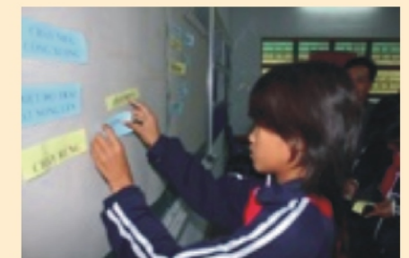
Chương trình trường học về DRR, Kon Tum