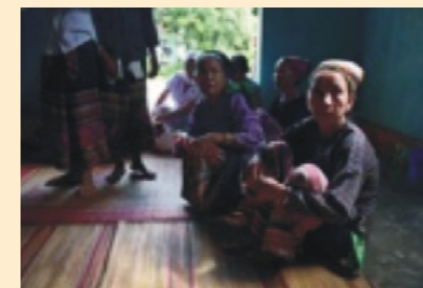
Phụ nữ trong buổi diễn tập DRR của xã Châu Lộc, Quý Hợp, Nghệ An

VCA là quá trình định hướng hành động tập trung vào những kết quả cụ thể nên cần thiết phải sử dụng những công cụ và ngôn ngữ rất thực tế. Chúng tôi khuyến cáo Hội CTĐ Việt Nam xem xét để phát triển phần C “Hướng dẫn thực hành đánh giá VCA” thành cuốn sổ chi tiết với một số các tài liệu có trong CD. Tài liệu này nên chia quá trình đánh giá VCA thành một số các bước nhỏ và nhờ đó sẽ nâng cao hiệu quả và mức độ thích hợp của Sổ tay VCA. Bằng cách bổ sung thêm các minh họa, biểu đồ, biểu mẫu, tóm tắt các chương mục và các ý thảo luận chính, Sổ tay VCA có thể sẽ trở nên dễ sử dụng hơn, đặc biệt đối với các hướng dẫn viên địa phương Những kiến nghị sau đây (từ 3.3.1-3.3.8) được đề xuất với mục đích nâng cao cách tiếp cận thực tiễn, tương tác và hướng dẫn đã được đề cập trong Sổ tay VCA.