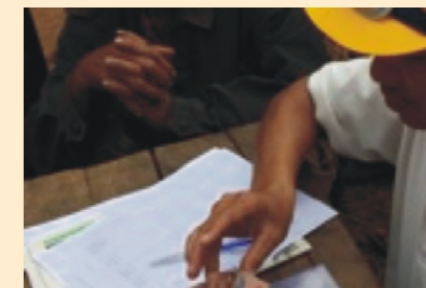
Thu thập dữ liệu để đánh giá VCA tại Kon Tum