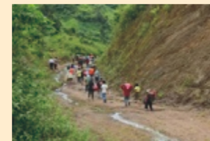
Diễn tập di tản dân ở Kon Tum

Ở xã Châu Lộc (Quỳnh Hợp, Nghệ An) có 85% dân số là người Thái, 15% còn lại là người Thổ và người Kinh. Xã có tổng số dân là 4.999 người thuộc 9 thôn. Xã gần kề Liên Hợp có 99% dân số là người Thái, trong tổng dân 2.085 người thuộc 6 thôn. Xã Châu Đình có tổng số dân 6.265 người thuộc 18 thôn, với người dân tộc Thái chiếm đa số dân cư.