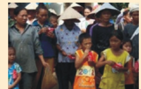
Hợp xã ở Châu Lộc, Nghệ An