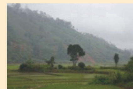
Mùa mưa ở Kon Tum