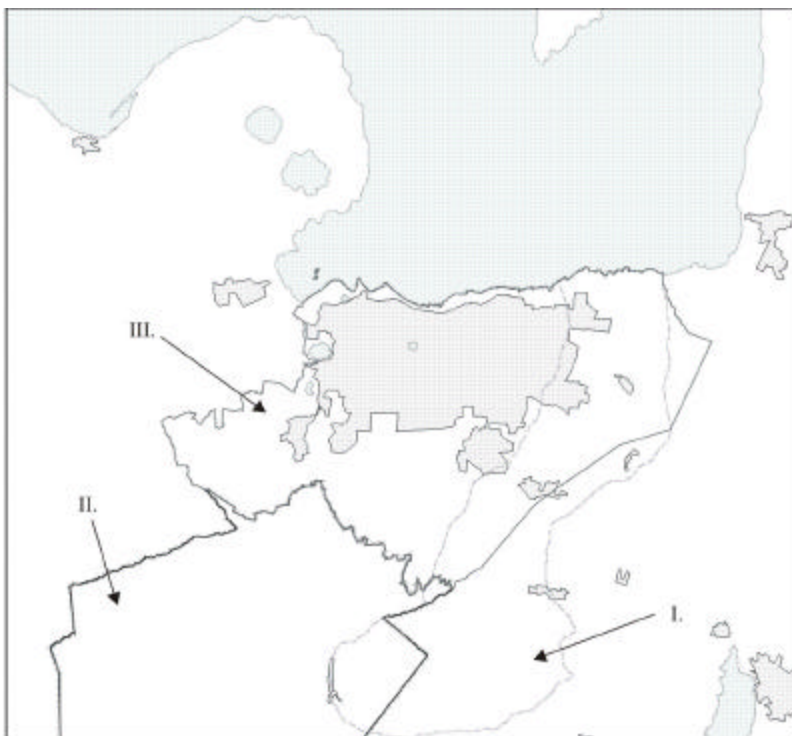
Figura 1: Fuentes de información e estudios: I. Ejército de Nicaragua, Dirección Defensa Civil, 2002; II. ARMECAM y compañía limitada, 2003; III. INTERCONSULT, 2002.

El estudio de Abt y Asociados a pesar de que cubre una parte importante del área para el proyecto no ha aportado resultados para la creación del mapa de amenazas debido a que su análisis es cuantitativo y no presenta mapas. El resto de los estudios han sido utilizados y a continuación hacemos un resumen de su contenido y metodologías empleadas.